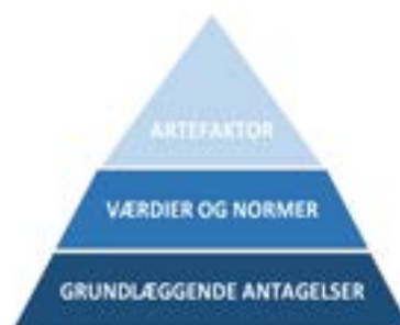
Figur 1: Scheins model for kulturniveauer (Modern Buisness: 2021)

Med denne forståelse af kultur vil vi bevæge os videre til at beskrive Scheins model for kulturniveauer (se figur 1), som vil fungere som et værktøj for os til at forstå vores case, særligt gennem vores observationer. Schein deler sin model op i tre niveauer: Artefakter, skueværdier og grundlæggende antagelser.