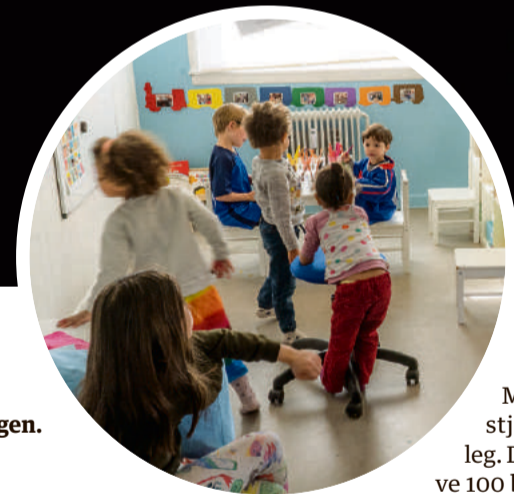
Hvis de store børnehavebørn er modne til det, må de også gerne deltage i skolen. Her tegner de i børnehaveafdelingen.